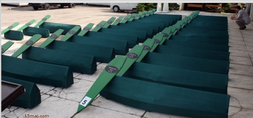
Ukop civilnih žrtava u Bratuncu

15. maj obilježen polaganjem cvijeće na spomen obilježja